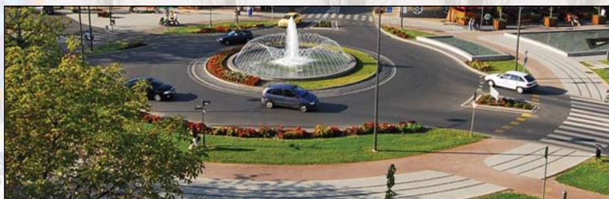
Ilyen lesz az új körforgalom